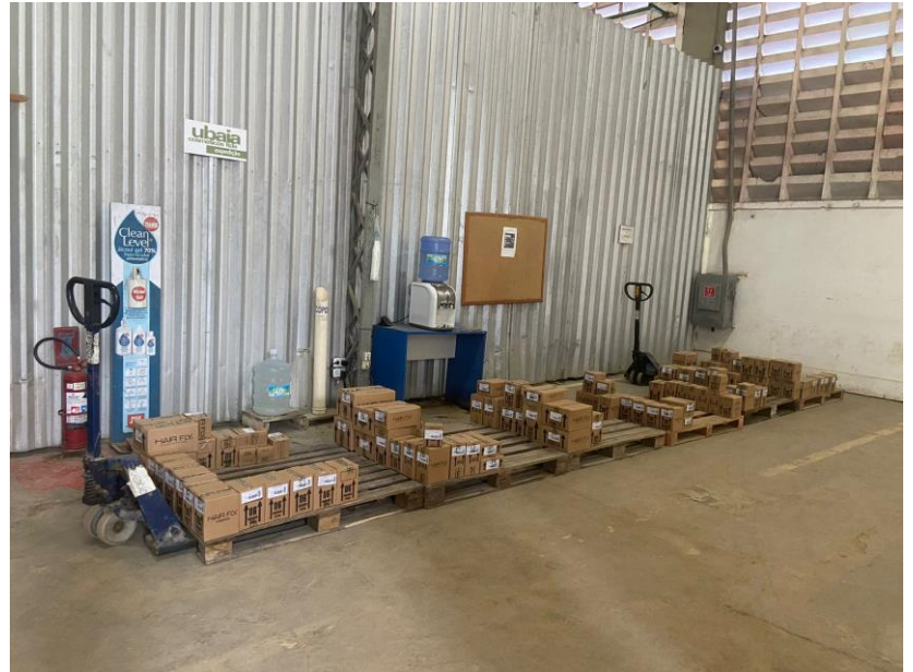
Nas imagens: Sede da Ubaia Cosméticos.

A Vivante reitera que está agendando com as Recuperandas para realizar a visita na sede da outra empresa do grupo, a APPG Distribuidora de Cosméticos, Perfumaria e Logística, cujas informações da visita serão expostas em relatório posterior.