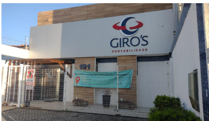
Rua Cândido Portinari, nº 191, Cambéba, Fortaleza/CE

Além disso, em contato com os vizinhos, tomou-se conhecimento de que a Giro's Contabilidade está fechada há 9 meses e nada se sabe sobre a falida Mix Quality.